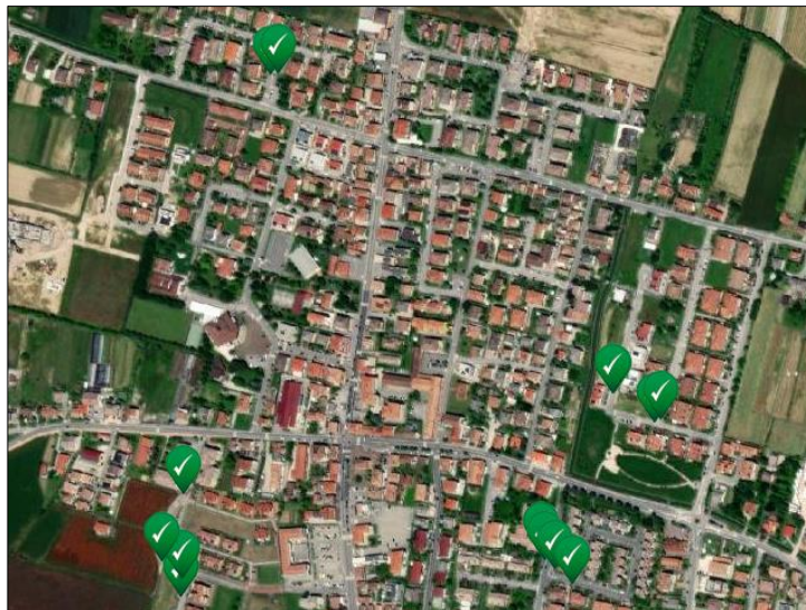
Mappa 1: Posizioni georeferenziate dei campionamenti nelle caditoie (Le coordinate GPS rilevate sul campo sono soggette ad un margine di errore di alcuni metri).